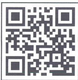
ประกาศรับสมัครและใบสมัคร

เรียน หัวหน้างานบริหารและพัฒนาคุณภาพ - เพื่อโปรดประชาสัมพันธ์บุคลากร ผ่าน KUSE News