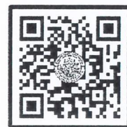
QR-Code ลงทะเบียนอบรม

ผู้อำนวยการสำนักงานบริการวิชาการ ปฏิบัติการแทนอธิการบดีมหาวิทยาลัยศิลปากร