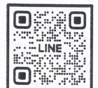
QR-Code ลงทะเบียนอบรม