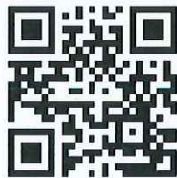
รายละเอียดโครงการ