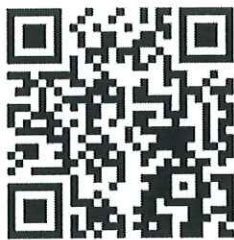
ลงทะเบียนส่งผลงาน

(ส่งผลงานนวัตกรรมสายอุดมศึกษา ประจำปี ๒๕๖๗ (Higher Education Innovation Awards 2024))