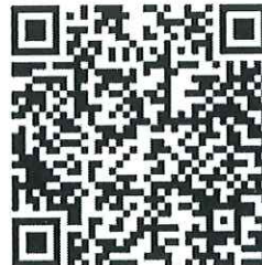
เอกสารประชาสัมพันธ์