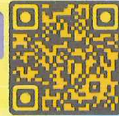
แบบฟอร์มสมัคร