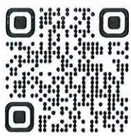
QR Code รายละเอียดฝึกอบรม

จึงเรียนมาเพื่อโปรดพิจารณาอนุเคราะห์และขอขอบพระคุณมา ณ โอกาสนี้